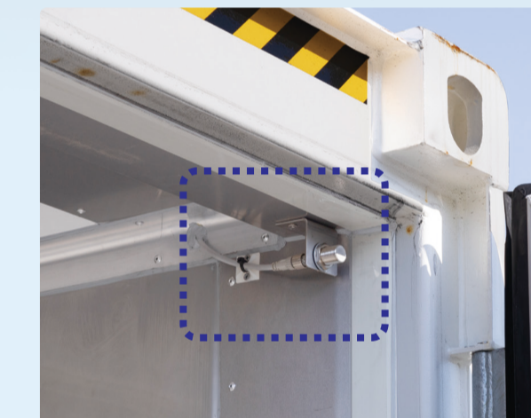
自動電場解除装置を搭載