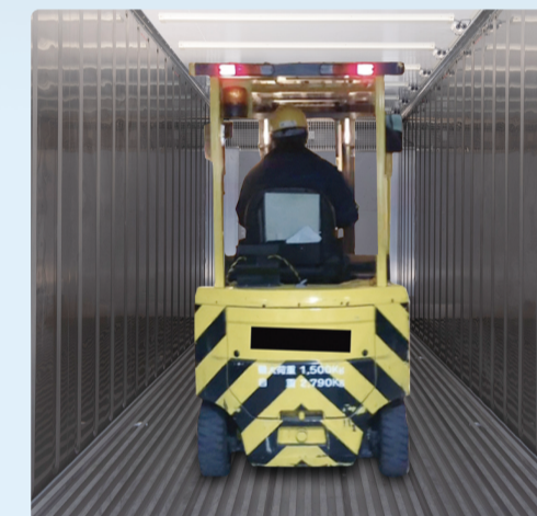
フォークリフト進入可能