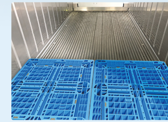
1,100mm×1,100mmパレットを横方向に2枚収納可能