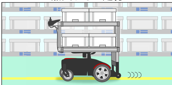
簡単に敷設できる反射テープのラインを検出